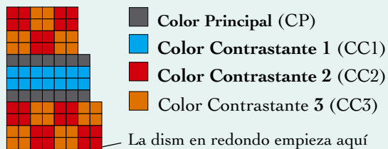
Diagrama para el suéter. Dism cada 4 vtas.

27 26 25 24 23 22 21 20 19 18 17 16 15 14 13 12 11 10 09 08 07 06 05 04 03 02 01